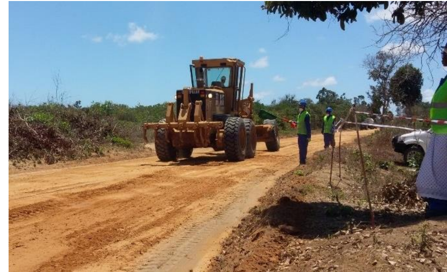
Manutenção da Estrada de Acesso ao Local